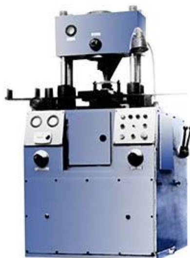
Рисунок 1. Пресс-автомат механической модели КО622Б производства Саранинского завода кузнечно-прессовых машин усилием 160 кН

В первую очередь такая механизация необходима для изготовления прокладок сжимающих и контейнеров ячейки высокого давления (детали НУМК.711141.001, НУМК.714341.001 ТП).