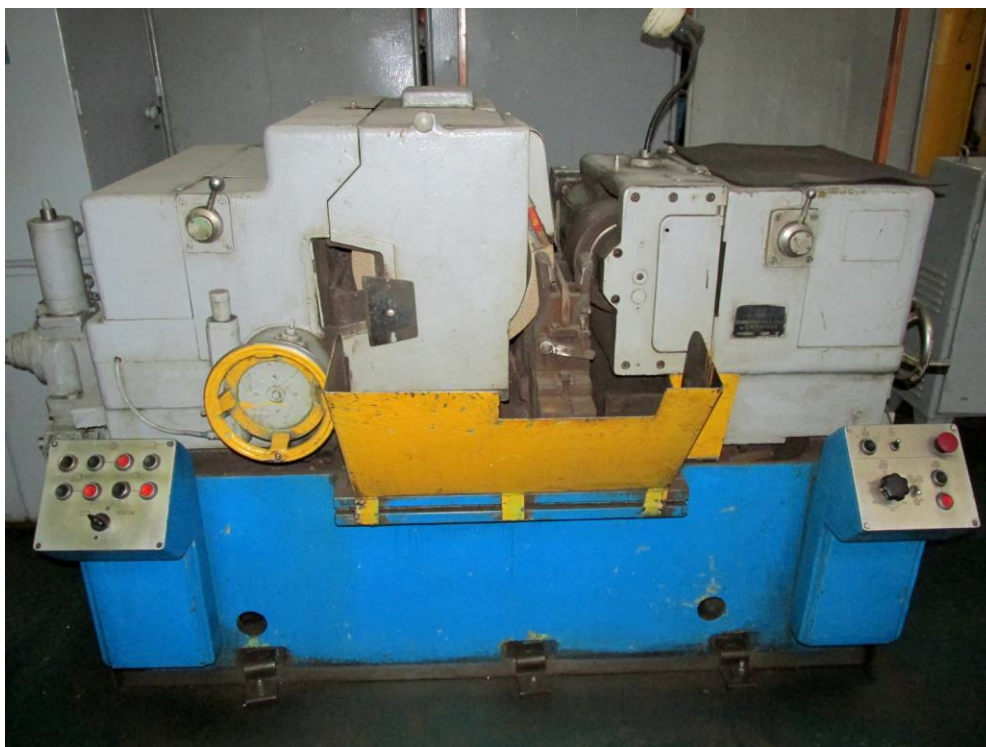
Рисунок 6. Станок для бесцентрового шлифования.

Шлифование на бесцентровошлифовальных станках имеет ряд преимуществ по сравнению со шлифованием на круглошлифовальных, а именно: