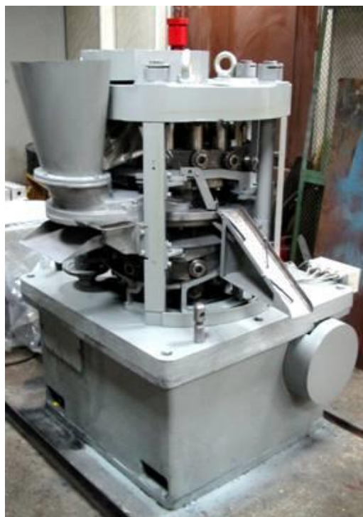
Рисунок 2 Машина таблеточная роторная МТ-3А.

использованием машин таблеточных роторных типа МТ-3А (МТР-16) – рисунок 2. Сайт производителя: http://www.polymermash.ru/content/view/116/lang?en/ .