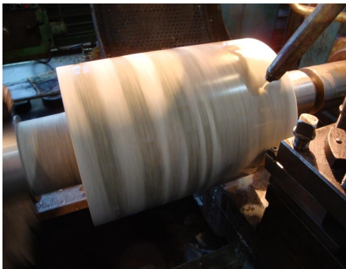
Рисунок 3. Проведение испытаний износостойкости материала режущего слоя – точение цилиндрической заготовки из гранита.

Определение износостойкости материала режущего слоя является важной контрольной операцией ТП. Операция основана на определении величины относительного износа исследуемого материала при точении образца гранита – рисунок 3.