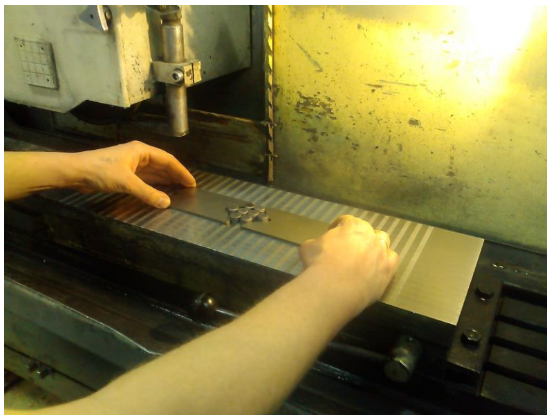
Рисунок 5. Фиксация образцов на магнитном столе плоскошлифовального станка 3Е711ВФ2.

магнитного стола для крепления при обработке. Изделия фиксируются на магнитном столе станка с помощью специальных приспособлений (кассет) – рисунок 5.